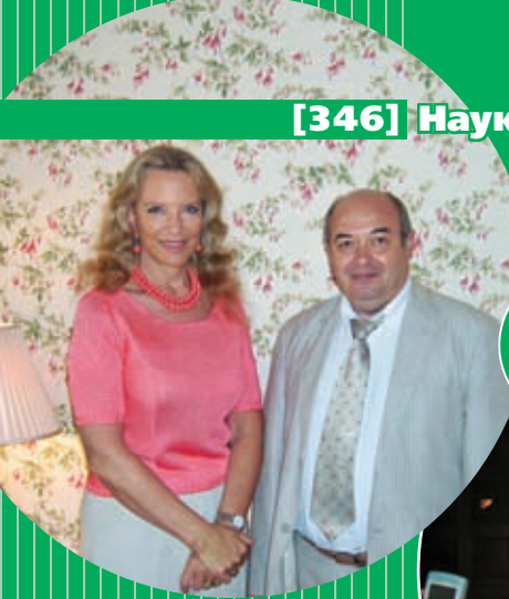
С Её Высочеством принцессой Кентской, супругой принца Майкла Кентского, двоюродного брата королевы Великобритании Елизаветы Второй, внучатого племянника Николая II Романова