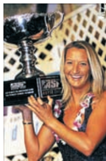
Layne Beachley – Лайне Бичли

Считаю, что выгоды от СКЭНАР-терапии почти безграничны для здоровья и самочувствия.