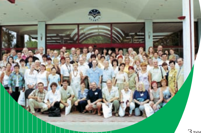
Самая успешная международная конференция, Болгария, 2004