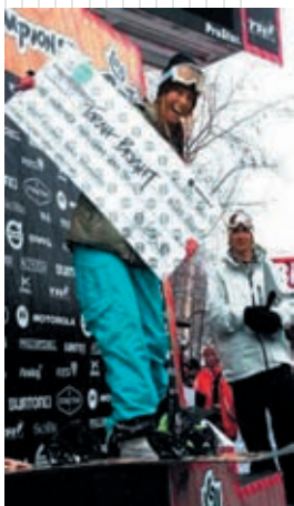
Torah Bright – Тора Брайт

– чемпионка мира по сноуборду по версии TTR, золотая медаль на X Играх 2007, на Открытом чемпионате Америки Halfpipe 2006